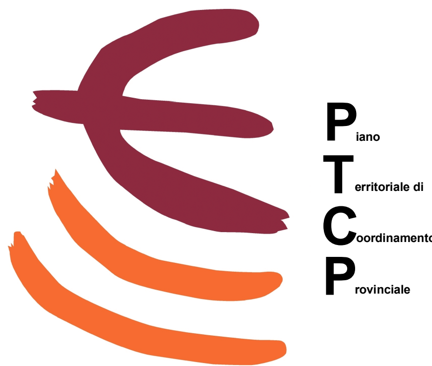
tavola di piano