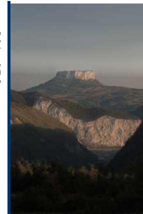
Pietra di Bismantova e Gessi triassici - Vanicelli

sito: www.ilcuoredellamontagna.com, e-mail asscuoremontagna@libero.it