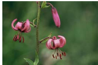
Il giglio martagone - F. Liverani

Menù a km zero, laboratori sulle produzioni tipiche dell'Appennino Reggiano e delle Città Slow, possibilità di conoscere e acquistare prodotti tipici e biologici. Due giorni dedicati al gusto e al vivere bene, rallentando il ritmo e assaporando ogni istante.