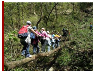
Giovani escursionisti al parco