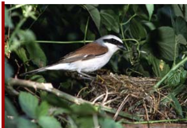
Averla piccola (moschio al nido)

Prenotazione obbligatoria: entro il mercoledì (max 6 persone).