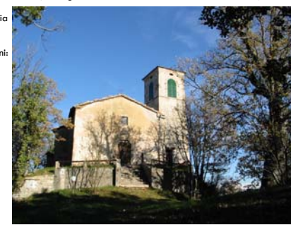
Chiesa di S. Paolo - archivio Riserva