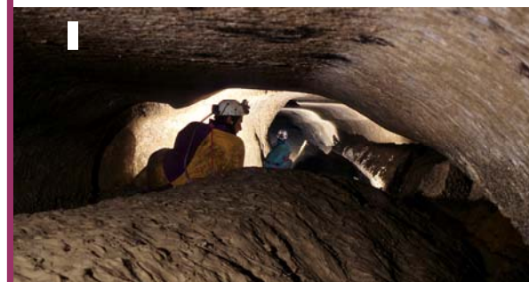
Grotta della Spipola