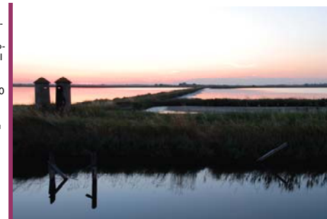
Saline di Cervia - F. Liverani

Suggestiva escursione a piedi avvolti dalle magiche atmosfere della salina al tramonto. Quota di partecipazione: € 6,00 intero – € 5,00 ridotto. Info e prenotazioni: Centro Visite Salina di Cervia.