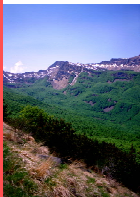
Panorama all'interno del parco - F. Dell'aquila

Informazioni: Parco del Frignano 053672134 info@parcofrignano.it