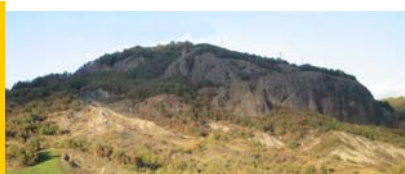
La Rupe di Campotrera vista da Cerezzola

Partecipazione gratuita e rivolta a tutte le età. Non è necessaria la prenotazione. In caso di maltempo l'iniziativa sarà rinviata. Per eventuale pranzo presso il B&B telefonare al numero 32-8.4920815.