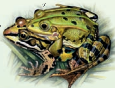
Rana di Lessona Pelophylax lessonae