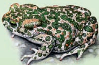
Rospo smeraldino Bufo lineatus