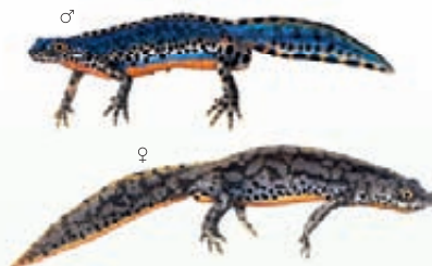
Tritone alpestre Mesotriton alpestris