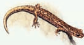
Geotritone di Strinati Speleomantes strinati