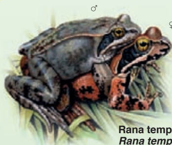
Rana temporaria Rana temporaria