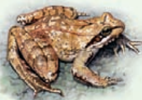
Rana appenninica Rana italica