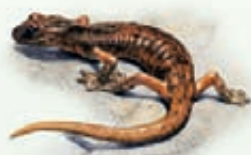
Geotritone italiano Speleomantes italicus