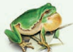
Raganella italiana Hyla intermedia