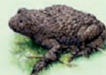
Ululone dal ventre giallo appenninico Bombina pachypus