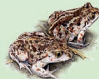
Pelobate fosco Pelobates fuscus