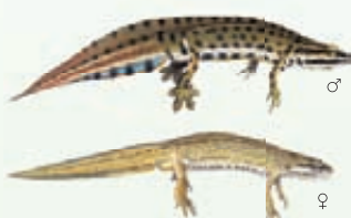
Tritone punteggiato Lissotriton vulgaris