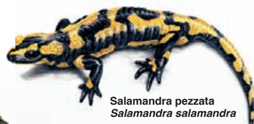
Salamandra pezzata Salamandra salamandra