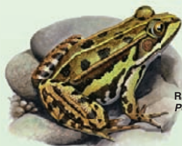
Rana esculenta Pelophylax klepton esculentus