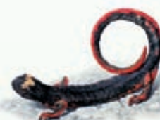
Salamandrina di Savi Salamandrina perspicillata