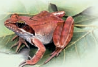
Rana di Lataste Rana latastei