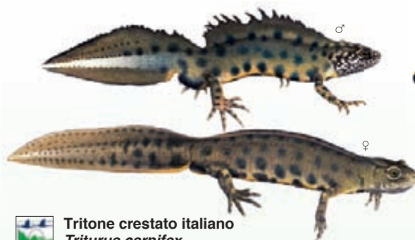
Tritone crestato italiano Triturus carnifex