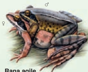
Rana agile Rana dalmatina