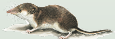
Crocidura a ventre bianco Crocidura leucodon