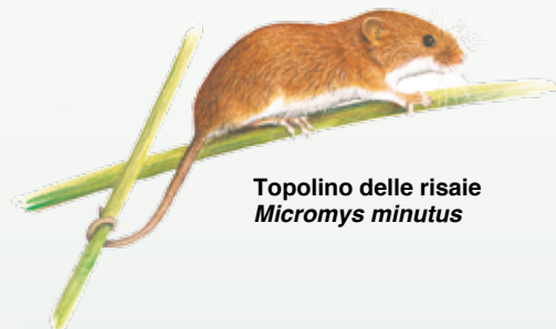
Topolino delle risaie Micromys minutus