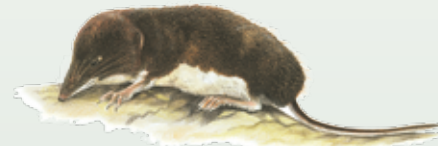
Toporagno acquatico di Miller Neomys anomalus