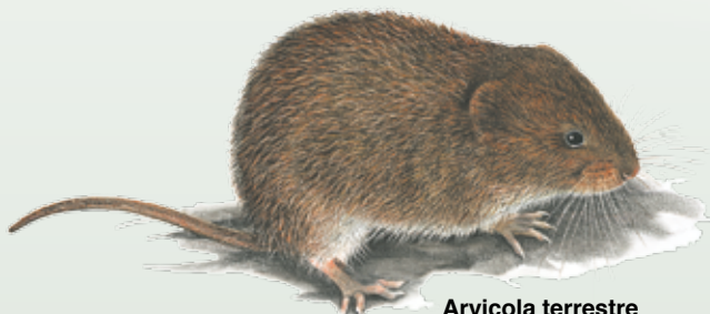
Arvicola terrestre Arvicola terrestris