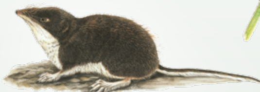
Toporagno d'acqua Neomys fodiens