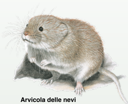
Arvicola delle nevi Chionomys nivalis