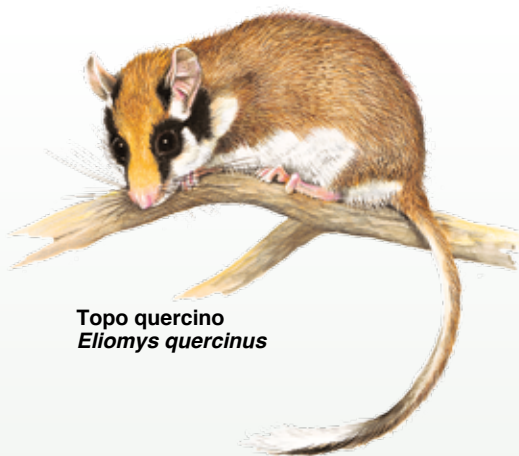
Topo quercino Eliomys quercinus