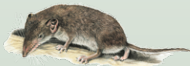
Crocidura minore o Crocidura odorosa Crocidura suaveolens